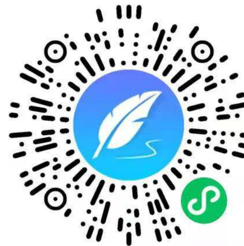
潮州市湘桥区南春中学面试报名现场审核预约