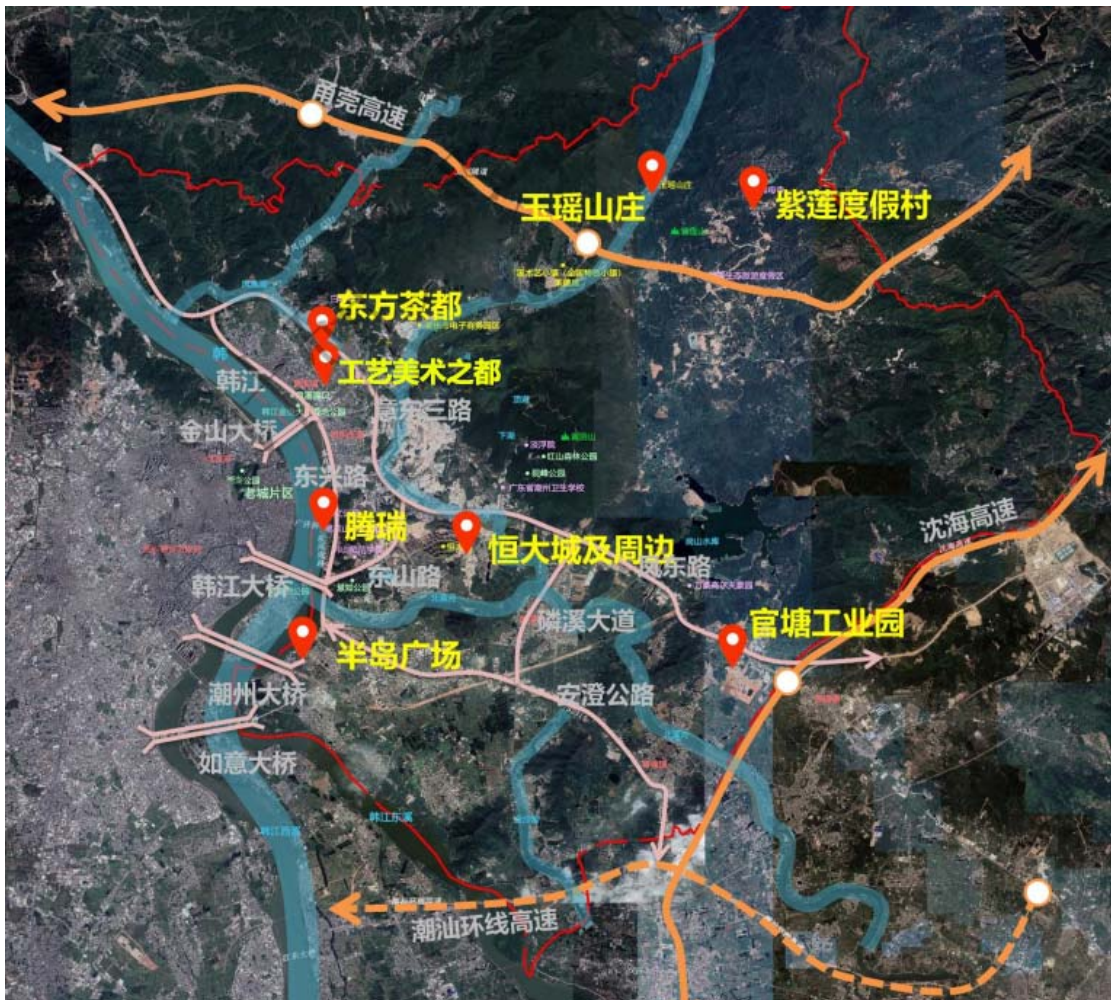
图 3 韩江新城已引入重大项目的空间分布