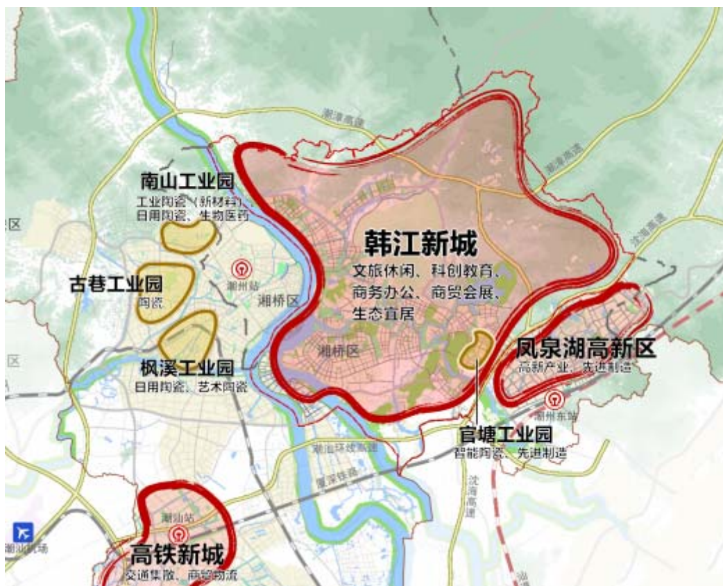
图 2 产业园区分布图

完善园区基础设施和公共服务设施。加快完善中山（潮州）产业转移工业园湘桥分园官塘片区、南山分园基础配套设施和生活服务设施，加强园区环境、治安和日常管理，优化投资营商环境。加快推进官塘片区一期、二期基础设施建设，有序扩大园区建设规模，围绕产业链上下游，加快引进一批优质高效项目落户。加快信息基础设施建设，积极推进“5G 园区应用”，引入专业化数字平台运营商，搭建园区统一管理智慧平台，建设智慧园区，全面提升园区企业信息化、智能化经营能力。建设中小企业服务平台，为园区企业提供“前台综合受理，后台分类审批，综合窗口出件”优质高效服务。建设园区人才综合服务平台，加强企业协调服务工作，全面做好生产要素保障、专利申报、升规入统等工作。加大